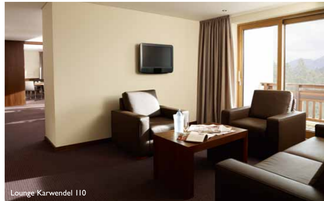
Lounge Karwendel 110