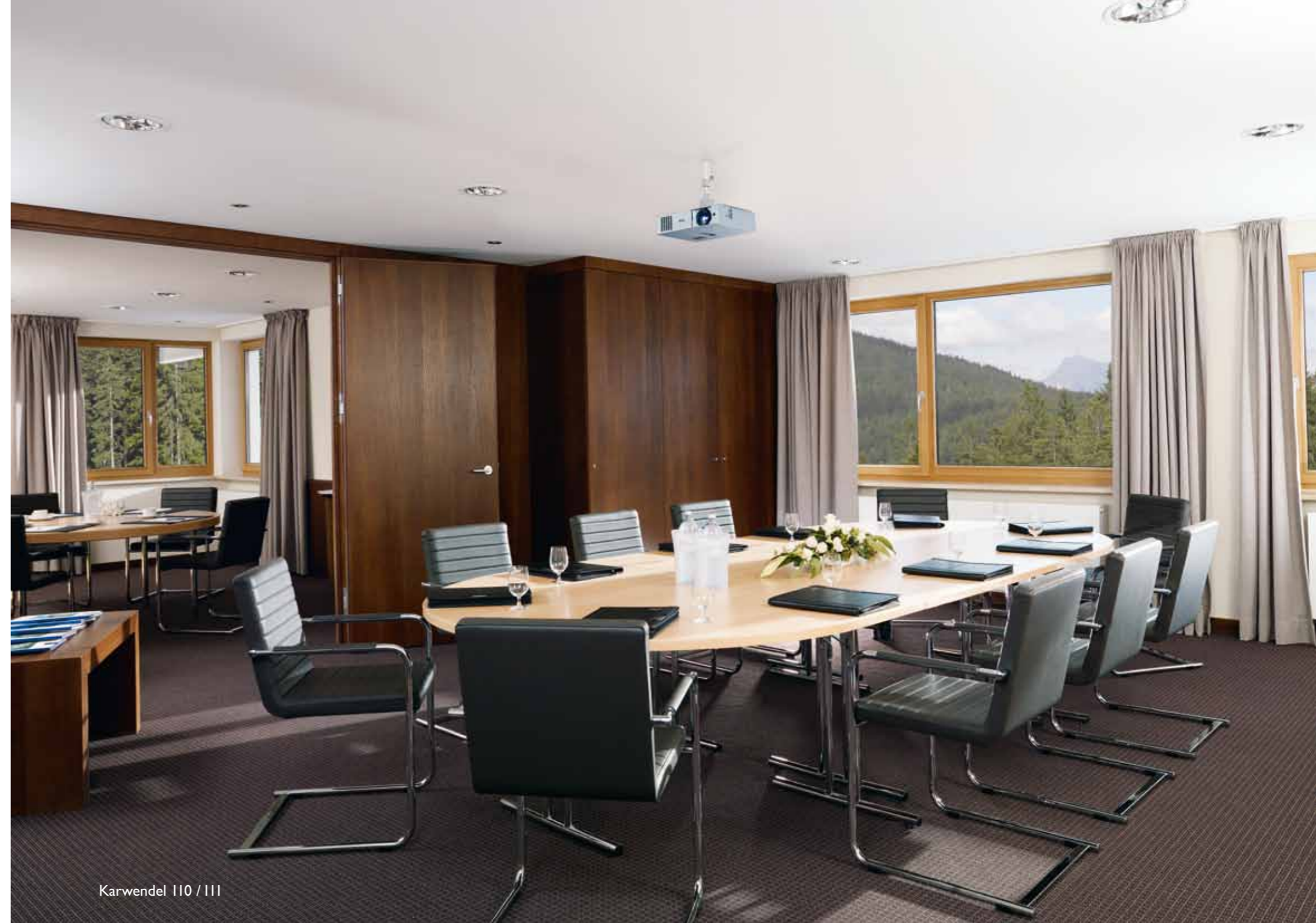
Karwendel 110 / 111